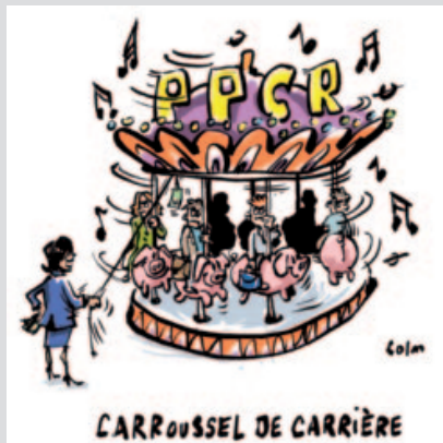
Grille des PE jusqu'au 31/08/2017

Vous trouverez ci-dessous un tableau détaillant le rythme de passage d'un échelon à l'autre ainsi que les anciennes grilles d'avancement. ■