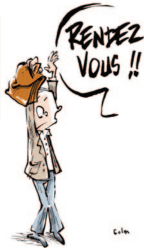
RENDEZ-VOUS DE CARRIÈRE

“ Aujourd'hui, j'ai reçu l'appréciation finale de l'IA-DASEN : « Satisfaisant » alors que ma note d'inspection est de 18/20 et que dans le tableau il y avait coché (4 satisfaisants – 6 très satisfaisants et 1 excellent) et que l'appréciation de l'IEN était très bonne. Sur quels critères s'est-elle arrêtée ?